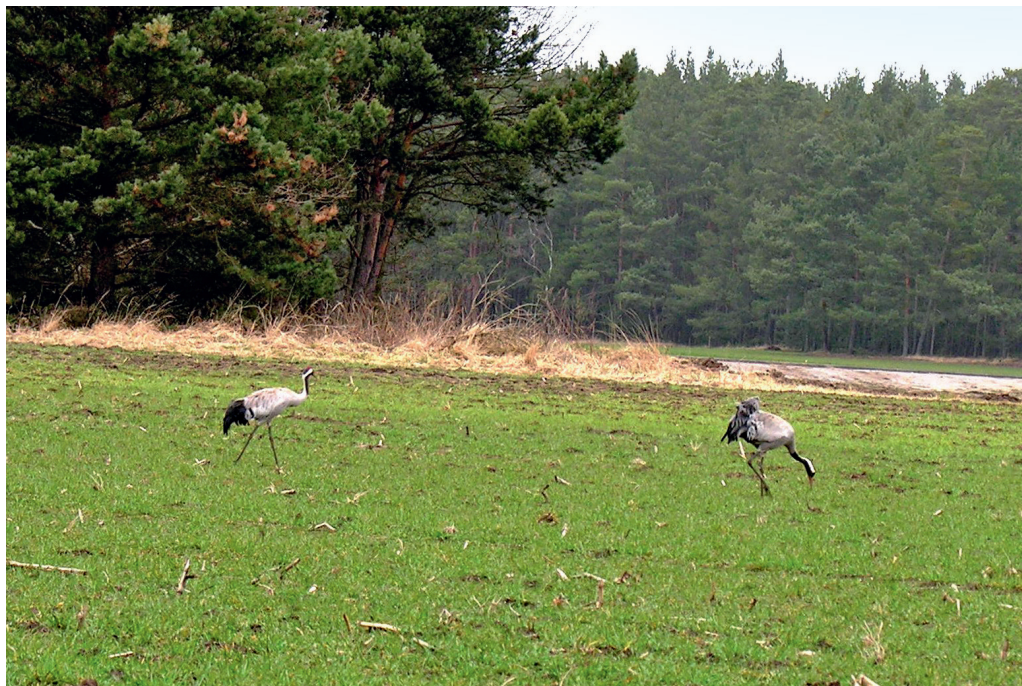
Kranichpaar im Frühjahr bei der Ankunft im Brutgebiet

Ulrich Augst, Nationalparkverwaltung Sächsische Schweiz