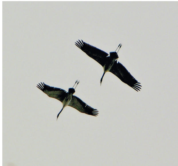
Fliegendes Kranichpaar; der größere Vogel ist das Männchen.

Im Frühjahr kommen die Kraniche aus ihren Winterquartieren in großen Flügen. Aus diesen sondern sich die einzelnen Paare ab und beziehen ihre Brutreviere. Lautes Rufen und auffallende anmutige Balztänze sind an der Tagesordnung, begleitet von schmetternden Duetttrufen. Dann wird das Nest errichtet. Dieses ist fast stets von Wasser umgeben und bietet somit einige Sicherheit vor Feinden. Kranichgelege bestehen in der Regel aus zwei großen, auf